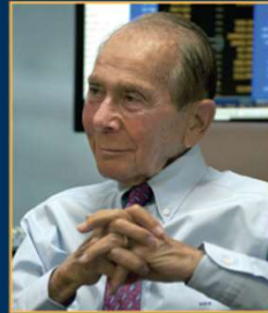
Maurice R. Greenberg

Asia Pacific Regional Manager CEO Starr International Insurance (Singapore) PTE LTD.